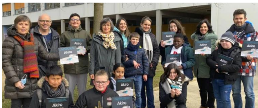
Les élèves des Clôteaux, avec l'équipe d'Art-Terre

https://www.amisep.fr/general/akiro-prix-du-meilleur-livre-adapte